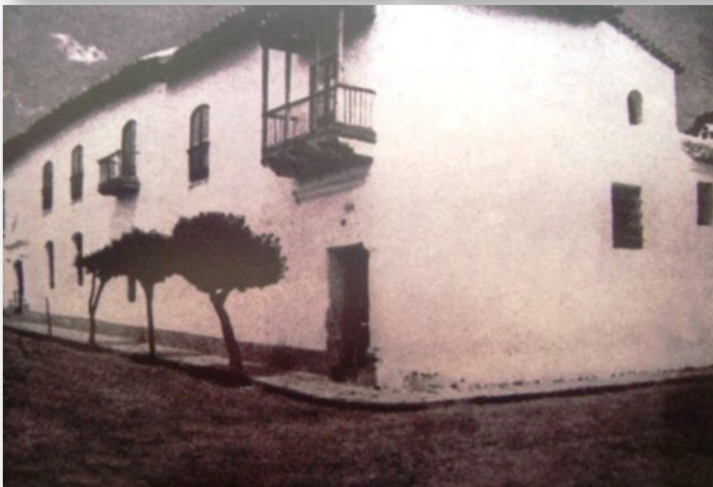
Fotografías de la casa Uriburu Cabero