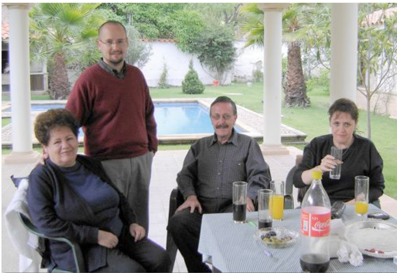
Familia Gutiérrez-Elliot 167

Economista, Administrador de Empresas, aficionado al arte y a la genealogía