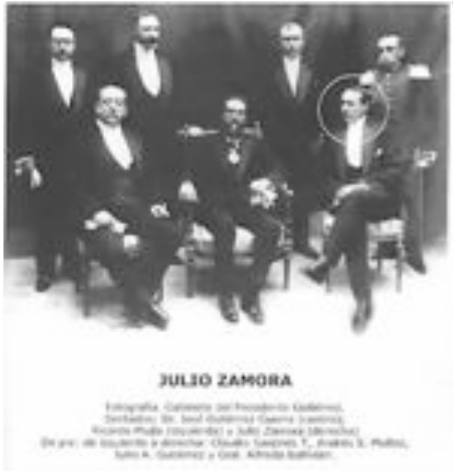
Presidente Gutiérrez-Guerra, con parte de su gabinete