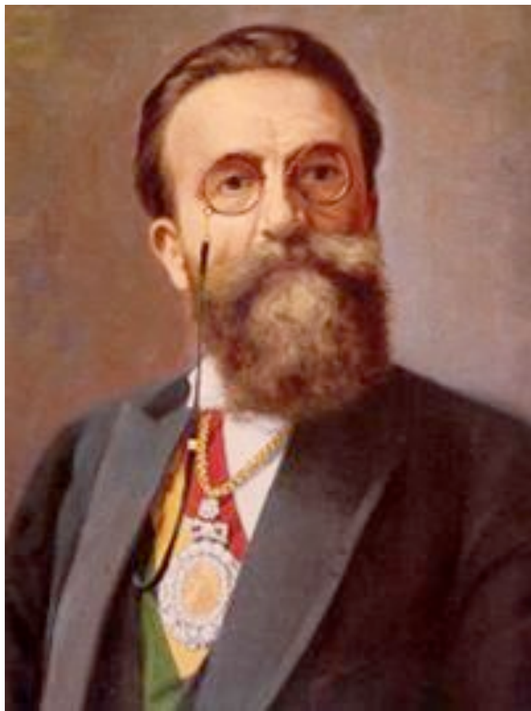
Dr. José Manuel Justiniano Gutiérrez-Guerra