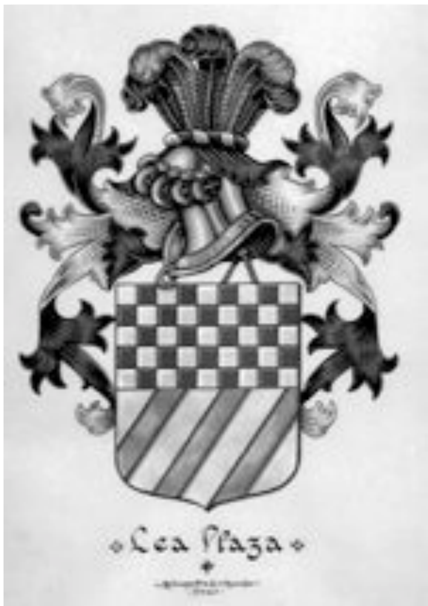
Escudo de armas de la familia Lea Plaza 30